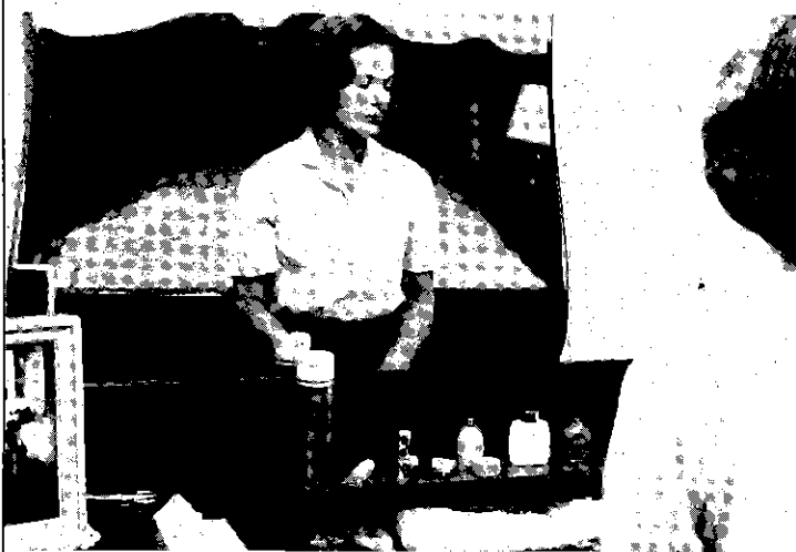
Chantal Akerman, Jeanné Dielman, 23 quai du Commerce, 1080 Bruxelles, 1975, filmstill