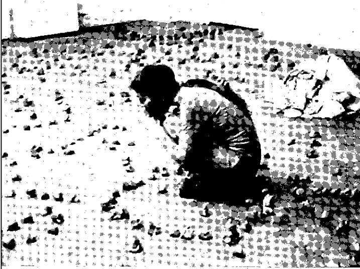
Sabine Lalande, Performance Colloque entre plures et una, december 1994, videostill, duur 12 min.

CORNÉ GABRIELS ontwierp onlangs een serie 'huiltukken' - eenvoudig draagbare sculpturen van sterk absorberend tissue - waarmee je rustig in een hoekje je tranen de vrije loop kunt laten. In GEDRAAG JE! ... zijn niet alleen het heimelijke, het alledaagse en het gereguleerde van het menselijke handelen bijeengebracht, maar ook de obsessieve en excessieve kant daarvan. Op 21 december 1994 tussen negen uur 's ochtends en 5 uur 's middags 'at' SABINE LALANDE zo'n tweehonderdtwintig kilo vochtige klei. Steeds nam ze weer een brok klei van de berg, stopte het in haar mond, mouleerde het met haar tong en tanden en spooog het daarna weer uit. Voor Lalande was deze uitputtende performance een persoonlijk ritueel waarmee ze een punt zette achter haar beginnende loopbaan als keramiste. Maar haar performance refereert tegelijk aan de problematische relatie die veel vrouwen hebben met voedsel, het dwangmatige eten en uitspuwen. Lalande's actie ligt in vergelijking met de andere bijdragen aan de expositie het meest duidelijk in het verlengde van de performancekunst uit de jaren zestig en zeventig, zoals bijvoorbeeld van Abramović/Ulay en Vito Acconci. Zij streeft naar een intense, authentieke ervaring, waarin ze de grenzen van haar fysieke kunnen opzoekt en die door niemand anders dan zichzelf kan worden uitgevoerd en beleefd. Net als Gerda Aigner blijft Lalande dicht bij haar eigen persoonlijke leven en geeft het werk het karakter van een rite-de-passage.