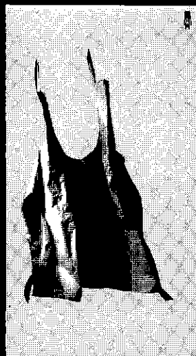
Caroline Coehorst, Z.T. (entree chinees restaurant) 1992, foto op linnen, 100 x 100 cm