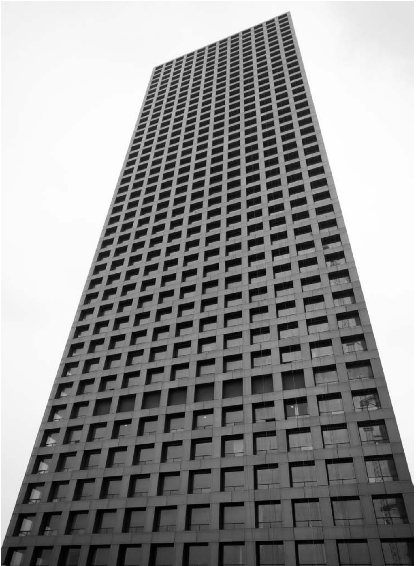
Zachary Formwalt, In Light of the Arc , 2013, two-channel HD-video installation, duration: 30' loop