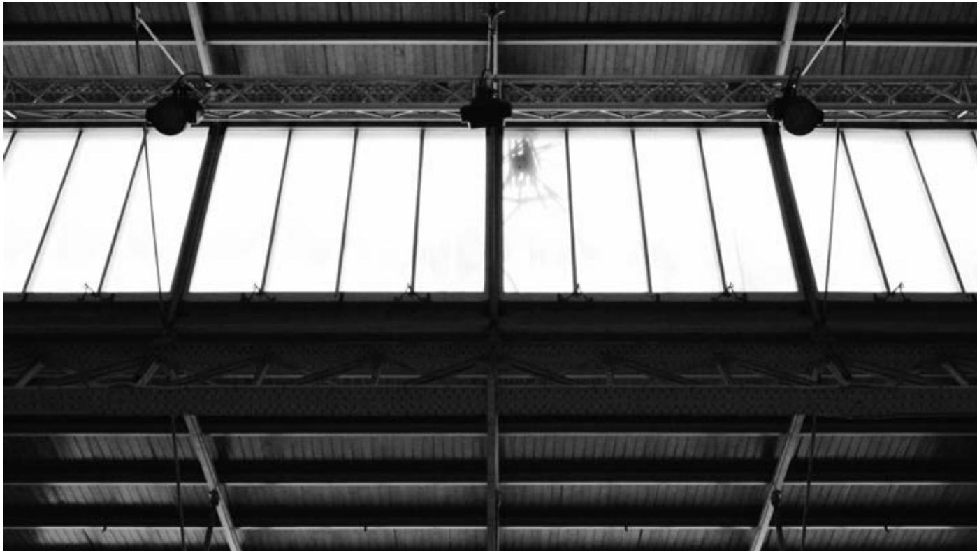
Zachary Formwalt, Grain , 2014, single-channel HD video installation, duration: c. 35'