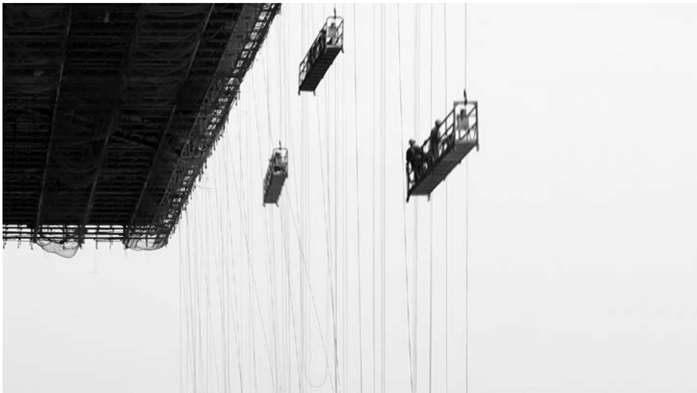
Zachary Formwalt, Unsupported Transit , 2011. single-channel HD video, duration: 14'25"