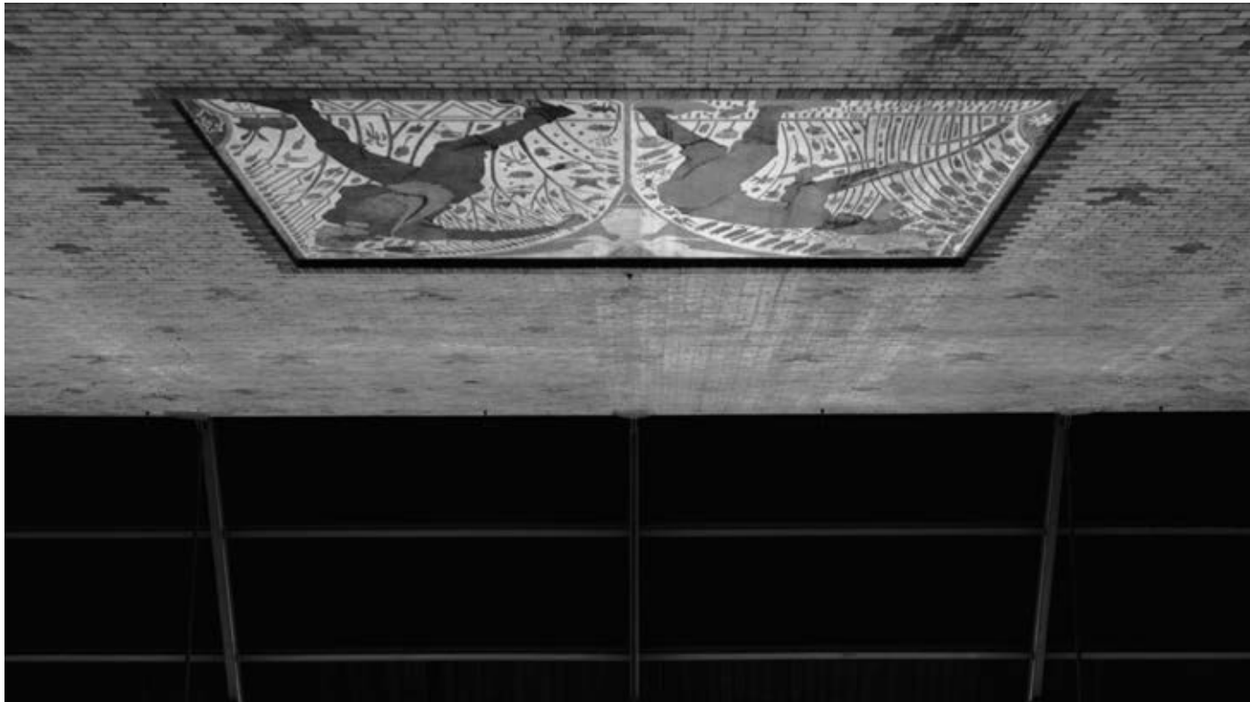
Zachary Formwalt, Grain , 2014, single-channel HD video installation, duration: c. 35'

the functions of light and heat for seeing and constructing, respectively, the built environment out of the very same phenomenon: the electric arc. The heat that is lost on the eyes is harnessed by the welder as the very means by which the steel framework of a building is put together, while the light that is unnecessary for the welder is harnessed by the projector in the cinema to make the moving images visible.