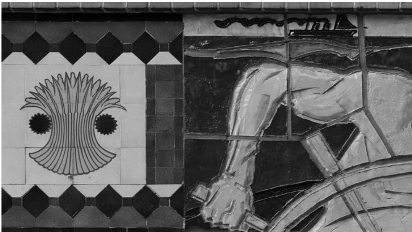
Zachary Formwalt, Grain , 2014, single-channel HD video installation, duration: c. 35'