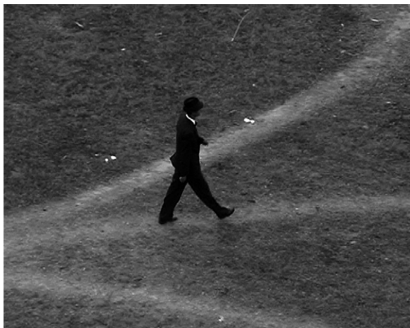
Vincent Meessen, Dear Adviser , 2009 (film still)