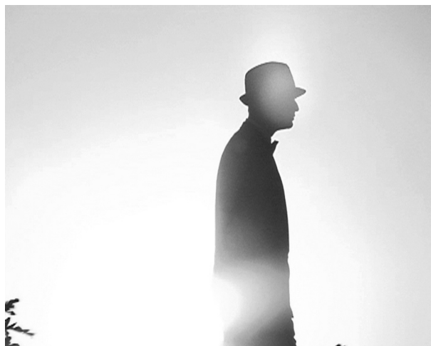
Vincent Meessen, Dear Adviser , 2009 (film still)

important government buildings, where Meessen’s film takes place, is striking. It is hardly accessible to the public any more for security concerns, because of the ethnic and religious tensions in the region. The Capitol is further characterised by an empty space at the site where the Governor’s Palace was once planned but never built, because of a further division of the state into Punjab and Haryana in 1966, with Chandigarh as the shared capitol. (At the time of the disintegration of British India, in 1947, Punjab had previously already been divided along rather arbitrarily chosen religious borders between Islamic Pakistan and Hindu India.) Le Corbusier’s idea of building a ‘universal’ museum based on the latest visual technologies in place of the Palace was not honoured.